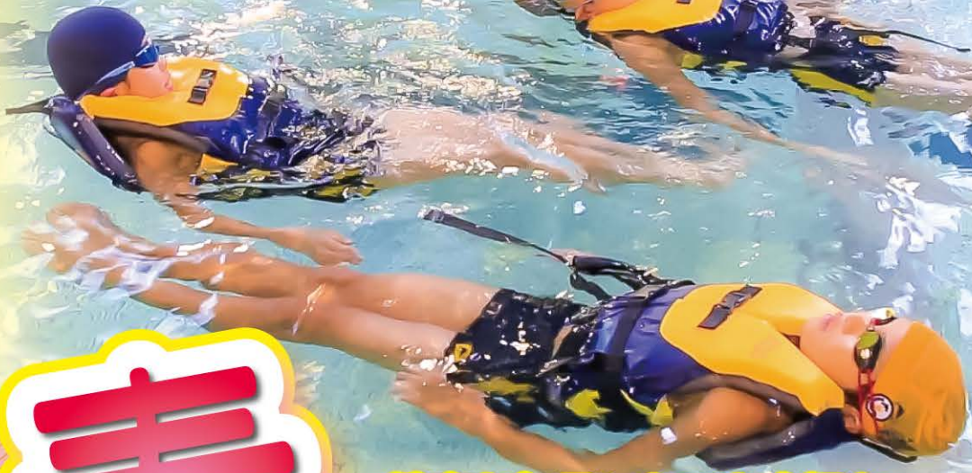
ライフジャケット(PFD)装着訓練