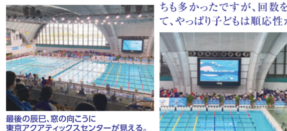
最後の辰巳。窓の向こうに東京アクアティクスセンターが見える。

また、今年も5月20日(土)~21日(日)の「いきいき茨城ゆめカップ」に出場します。昨年度に続いて今年度も遠征に参加できるようになりました。今回は昨年よりも多くの選手を連れていけることになりました。たくさんの子を決勝に残せるように、頑張ってください。次回の記事でいい結果を皆さんにご報告できますように! (今川)